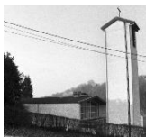
La Vierge des pauvres à Moulins-sous-Fléron,