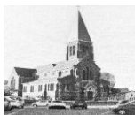
St Barthélemy à Beyne