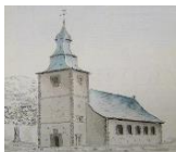
St Pierre à Saive